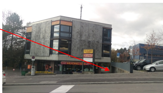
Bâtiment des Falaises