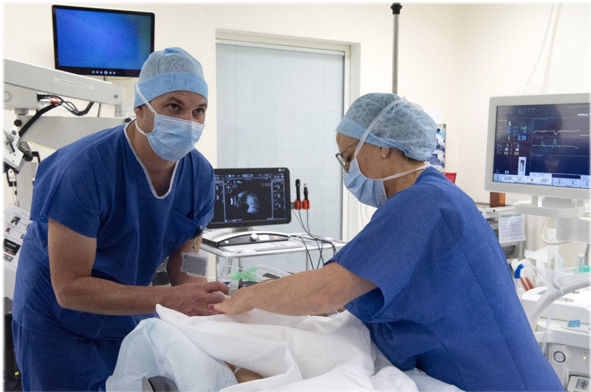
© Une anesthésie au bloc opératoire de l'Hôpital ophtalmique

Un partenariat institutionnel entre les services d'anesthésiologie de l'Hôpital ophtalmique Jules-Gonin et du CHUV a vu le jour. Il s'inscrit dans une vision commune d'optimiser les prises en charge des chirurgies ophtalmiques pédiatriques et ouvre la voie à d'autres collaborations entre les deux services.