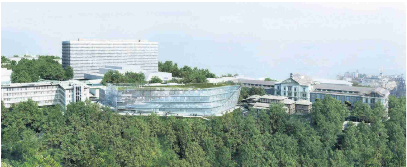
Nommé Agora, l'édifice qui réunira chercheurs, techniciens et médecins prendra place en face du CHUV, à Lausanne. PHOTOMONTAGE/EHNISCH ARCHITEKTEN

«En parallèle, nous allons continuer à allouer des fonds aux pro-