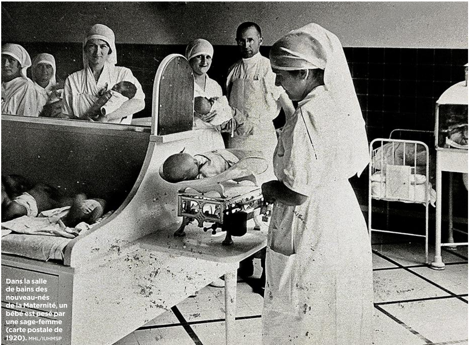
Dans la salle de bains des nouveau-nés de la Maternité, un bébé est pesé par une sage-femme (carte postale de 1920).

Expo, ateliers, conférences: la Maternité du CHUV fête son jubilé en grand