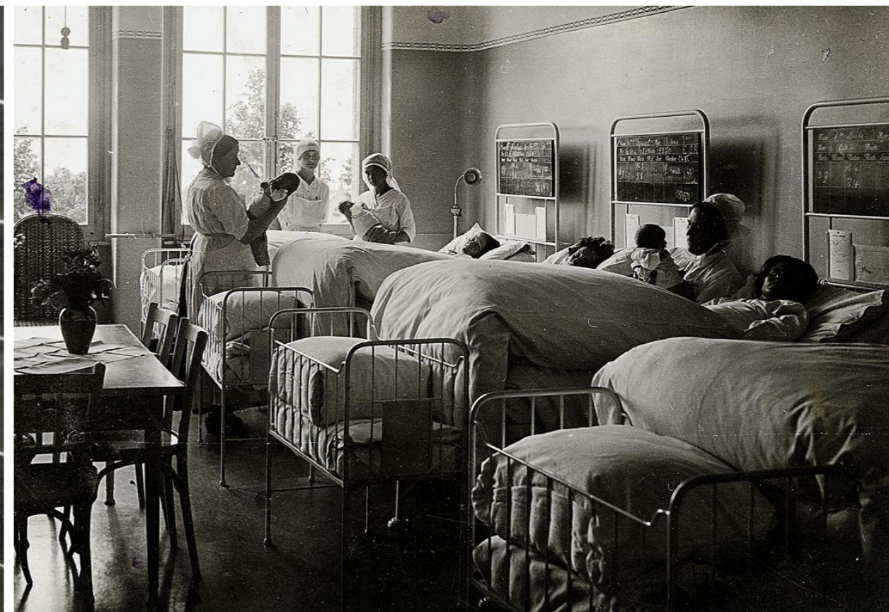
Une des chambres communes de la Maternité, pouvant accueillir six mères et leurs bébés.