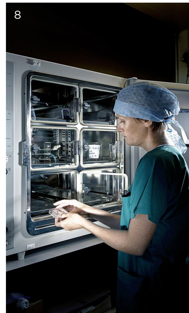
Le recours démocratisé à la fécondation in vitro (ici, la congélation d'ovocytes) augmente le nombre de naissances multiples.