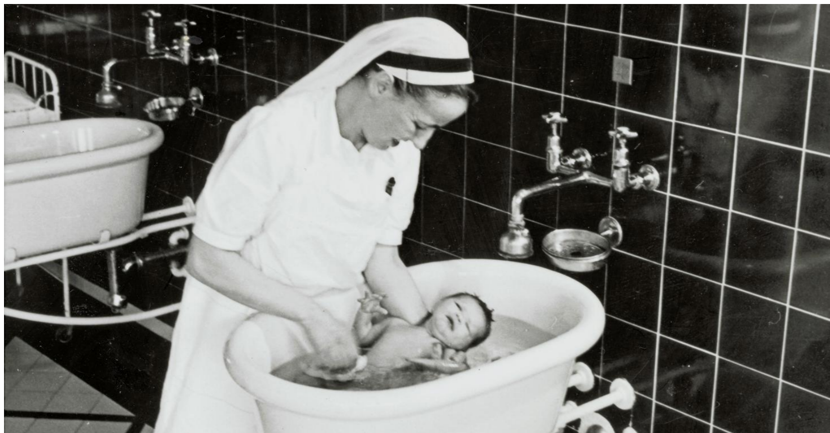
Une sage-femme baignant un bébé dans la salle de bains des nouveau-nés de la Maternité (carte postale, vers 1920).

A l'orée du XX e siècle, accoucher à la maison, loin de l'hôpital et de ses malades, était plus sûr pour les bébés. Les progrès en matière d'hygiène et de technologie ont inversé la tendance. Cent ans d'une belle histoire