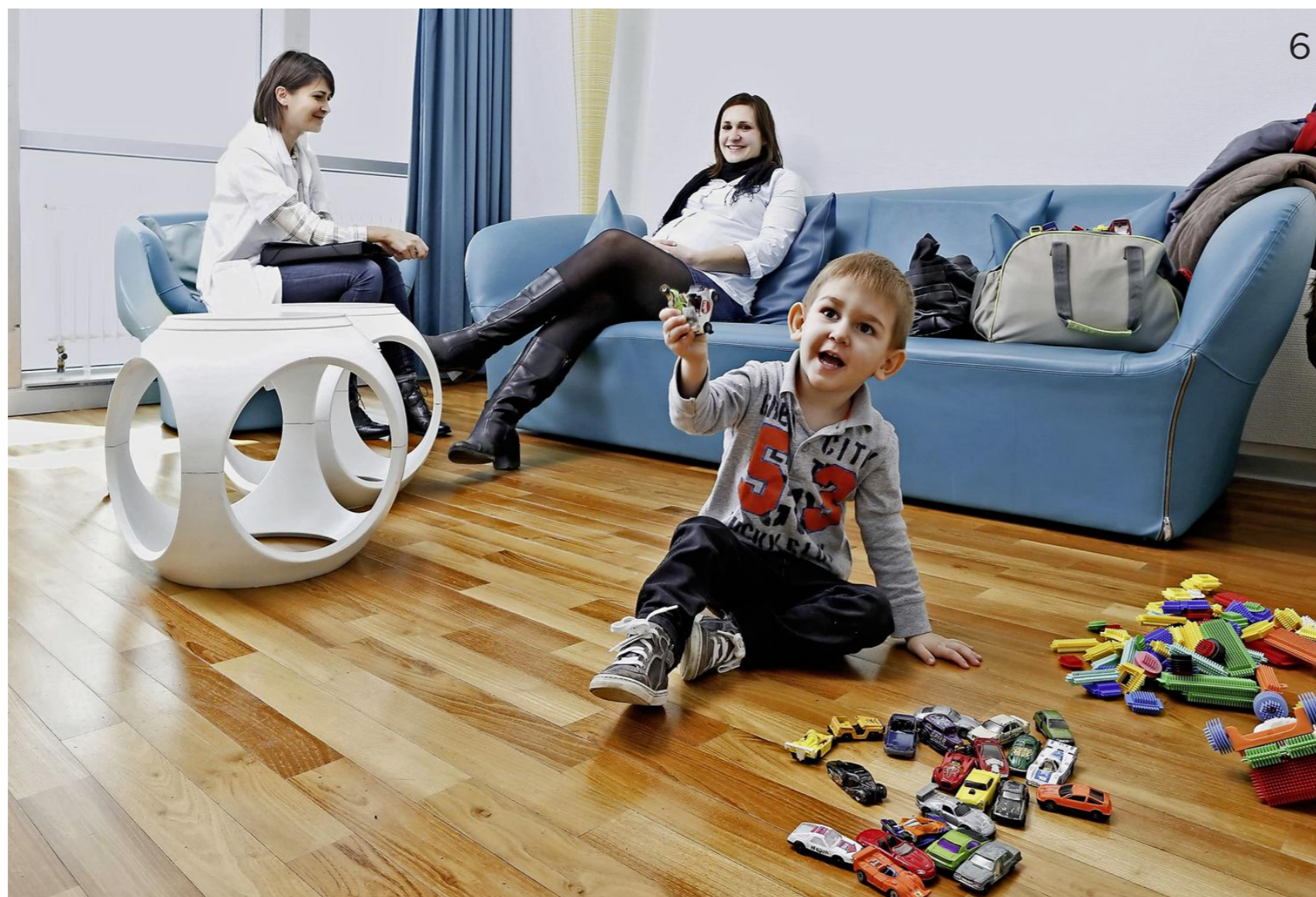
Ouvert en 2009, l'Espace Parents-Familles du Service de néonatalogie offre un havre de paix aux parents d'enfants hospitalisés.

Parmi les nombreux enjeux liés à l'allaitement, celui des enfants malades ou prématurés représente un défi particulier. Si les bénéficiaires sont d'autant plus grands pour cette population vulnérable, les taux d'allaitement sont significativement plus bas (65% au Service de néonatalogie contre 90% de taux moyen à la sortie de la Maternité). Les causes sont multiples: stress inhérent à ces situations difficiles, éloignement physique de la mère, accouchements moins favorables à la montée de lait... Pour lutter contre le sous-allaitement des nouveau-nés hospitalisés et remonter le taux à 75-80% au moins, le Service de néonatalogie a créé une Unité de soutien multidisciplinaire à l'allaitement maternel - en complément du soutien existant pour les mères et nouveau-nés séjournant en maternité - dévolue spécifiquement aux situations d'hospitalisation néonatale. Une conseillère en lactation est disponible pour les mères douze heures par jour. «Le but est de