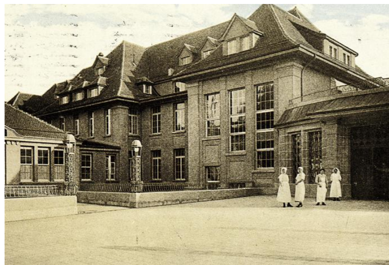
Le bâtiment de la maternité sur une carte postale de 1918.

de novembre 1916 pour l'inauguration officielle. Un journaliste de la Gazette de Lausanne a pu faire la visite des lieux avant son inauguration. Il écrit dans l'édition du 19 novembre: «La Maternité est aménagée pour 80 lits, les chambres ont six lits chacune (...). Tout a été étudié avec un soin tout particulier en vue d'une aseptie complète.» Un autre article, publié le 26 novembre, donne la parole au