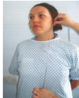
Etape 2: distance oreille- creux épigastrique