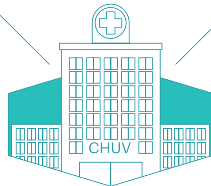
Centre hospitalier universitaire vaudois